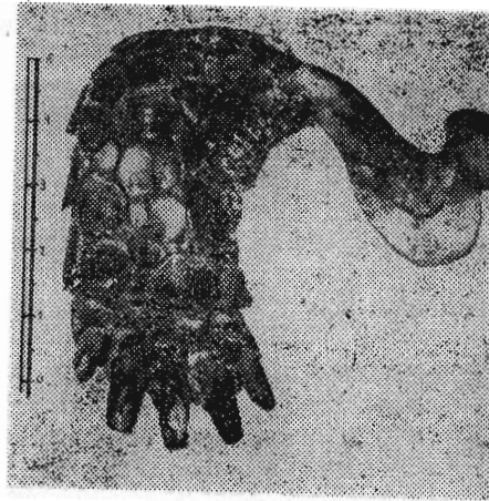
Рис. 2. Правая передняя нога спереди Testudo graeca iberica Pallas, 1811; (экземпляр из типовой территории)

Паратипы: 5 экземпляров, коллекция Кавказского заповедника, Сочи. № 7—11. Погибшие в природе черепахи из различных пунктов юга Краснодарского края (сборы Б. С. Туниева за последние 15 лет).